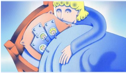
Illustratie Hanneke Rozemuller

Andreas Kouwenhoven, Bram Endedijk 5 april 2024 • Leestijd 15 minuten